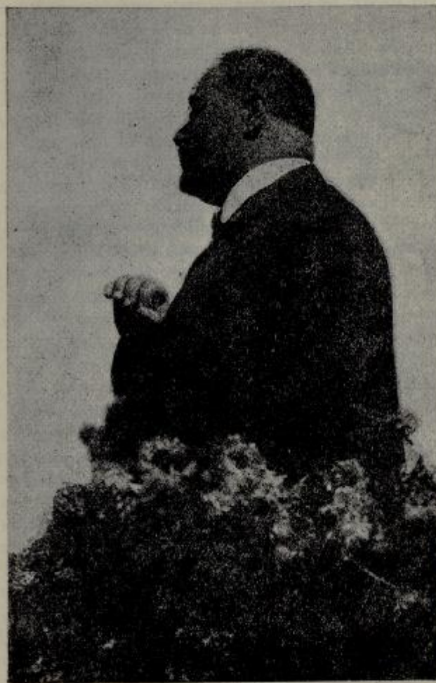
† СТЈЕПАН РАДИЋ

Али убрзо настале су интриге. Прво се говорило да Пашић није потписао споразум, затим да је споразум тајан и да се не објављује јер садржи одредбе против државног јединства. То је Пашић све демантовао. Али политичка ситуација није била довољно логична самим фактом што је странка Стјепана Радића била у влади, а он сам изван те владе. Уз то још било је интрига и тешкоћа. Веља Вукићевић излази из владе, поглавито неслагањем са Хрватима. То је био први потрес. Реконструкцијом Стје-