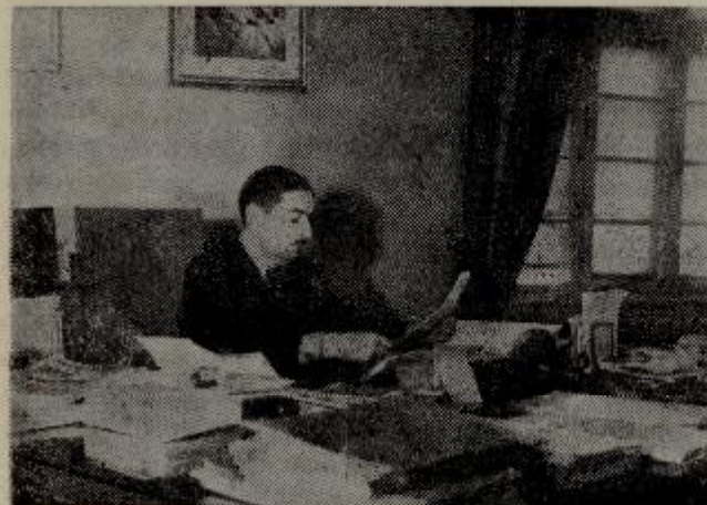
Г. Драгиша Цветковић, председник Министарског Савета

на основне проблеме државе. „Ако се тиме хтело рећи — пише „Хрватски Дневник“ — да је важно да се узму у обзир и ти хрватски погледи, онда је то добро“. Тако ће се, занста, обезбедити „пуно спокојство у земљи, економско благостање и мир“ — како се каже у декларацији.