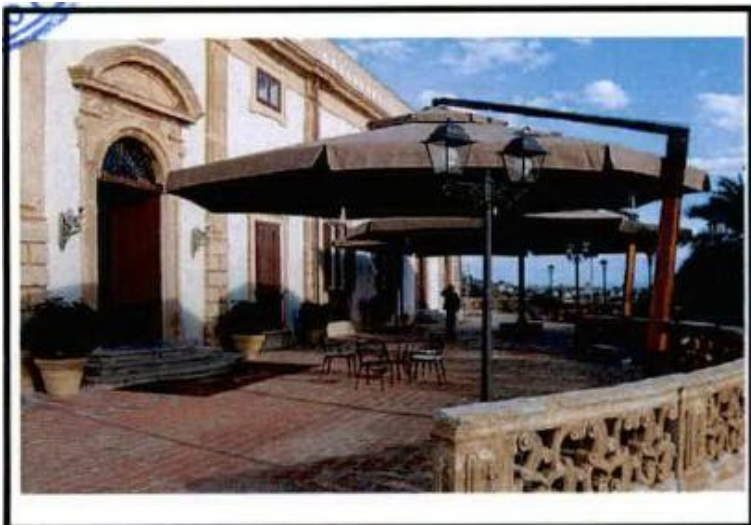
СЛИКА 1 (СУНЦОБРАН)