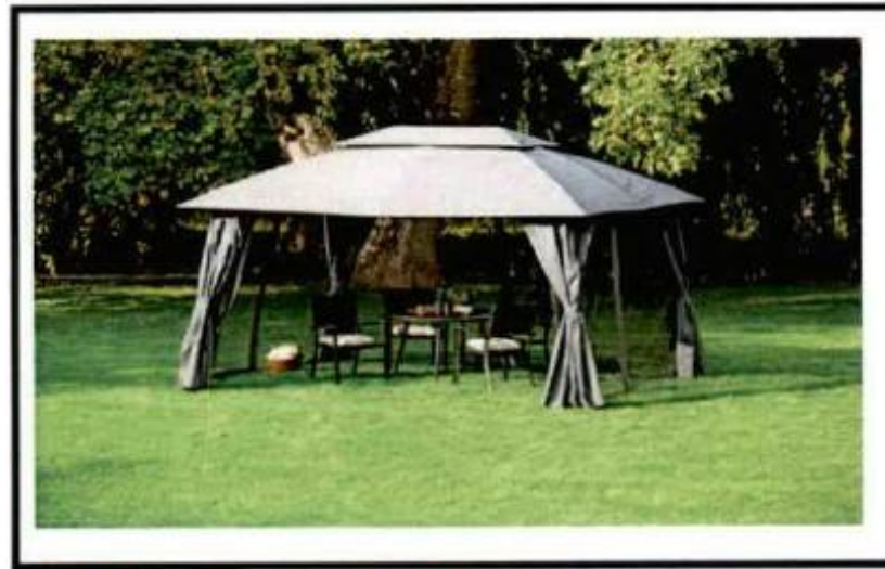
СЛИКА 2 (ПАВИЉОН)