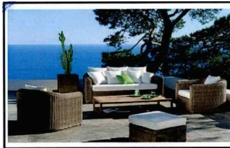
СЛИКА 4 (БАШТЕНСКА ГАРНИТУРА ТИП 2)