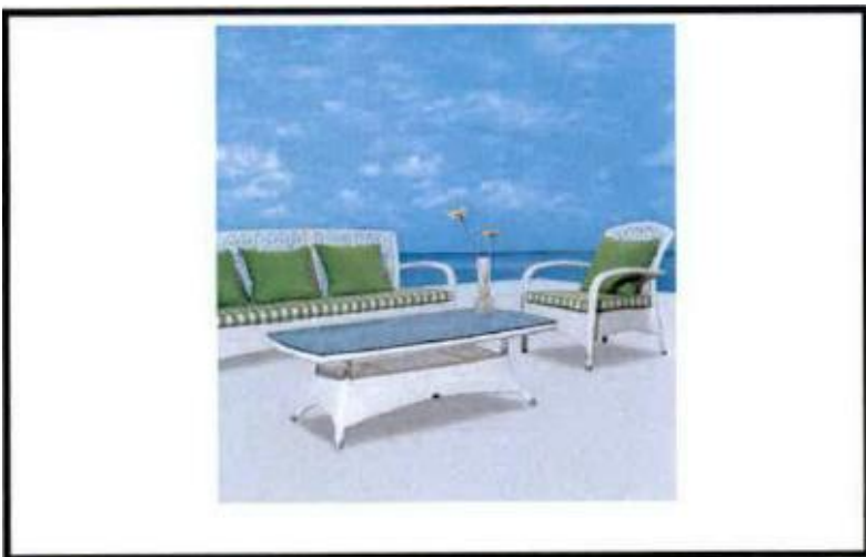
СЛИКА 3 (БАШТЕНСКА ГАРНИТУРА ТИП 1)