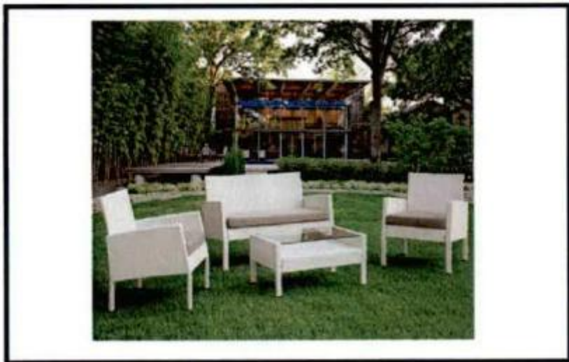
СЛИКА 5 (БАШТЕНСКА ГАРНИТУРА ТИП 3)