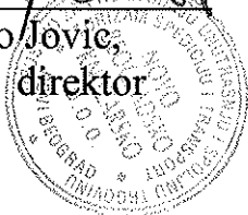
Momcilo Jovic, generalni direktor

Kojim se ovlašćuje Silvija Podleznik, JMBG 1512977777016, da u ime firme Novo Beogradsko Knjizarsko može potpisati okvirni sporazum za partiju 9 za nabavku kancelarijskog materijala CJN 4/2017.