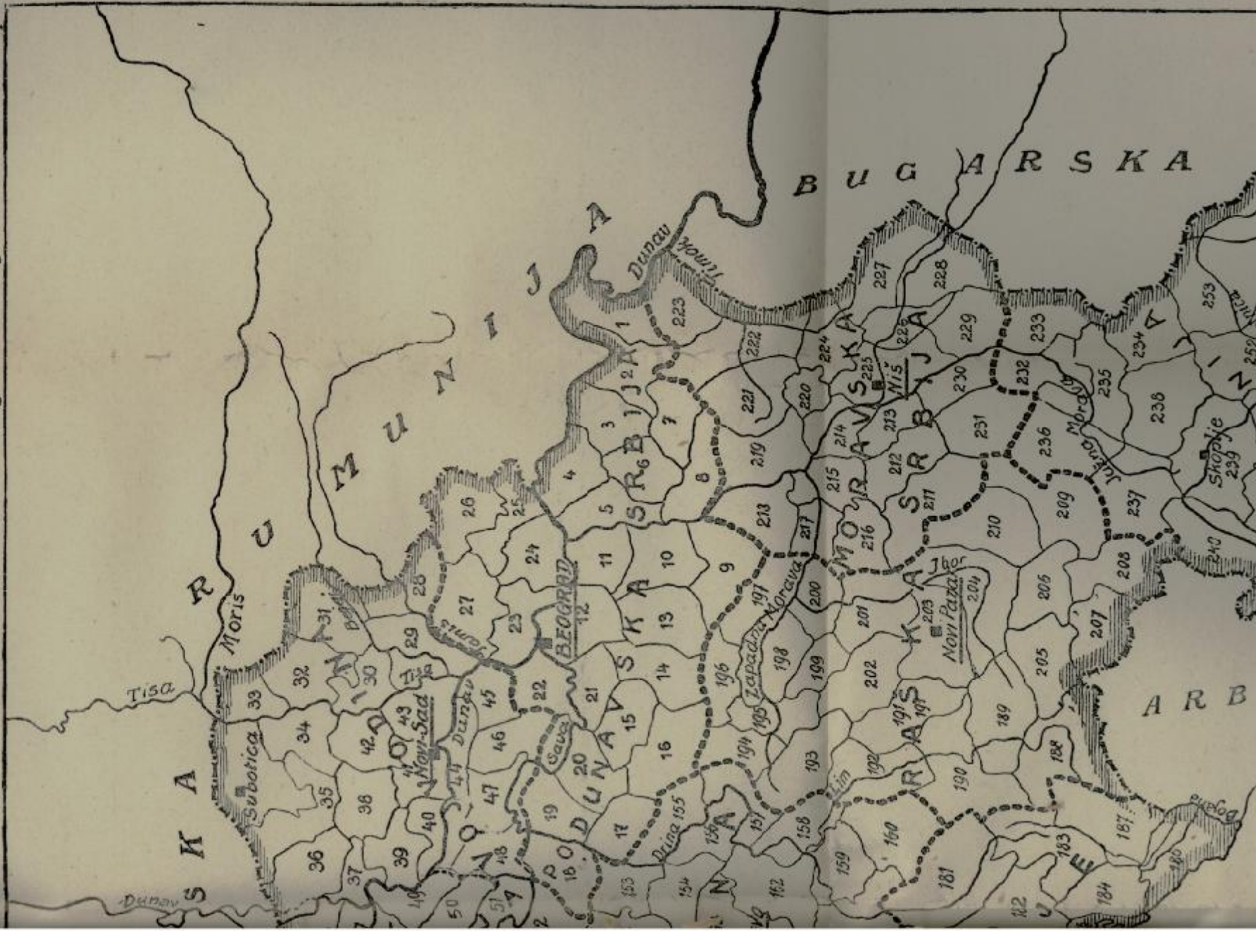
Dodatak I. Nacrtu Jugoslovenskog Ustava.