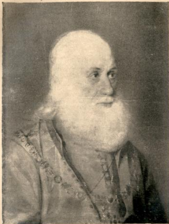
МИТРОПОЛИТ СТЕВАН СТРАТИМИРОВИЋ

Из страха да се устанак не прошири и да султан о свему не буде извештен, дахије су похитале да поведу с Карађорђем преговоре за измирење. Састанак између Аганлије и Карађорђа одржан је у селу Др тупи, на пола пута између Београда и Крагујевца и завршен је битком. Аганлија је рањен и његова пратња, после осетних губитака, морала је побећи с њим у Београд. И покрај тога дахије су одлучиле да наставе преговоре. Изасланици су им били београдски митрополит Леонтије и не-